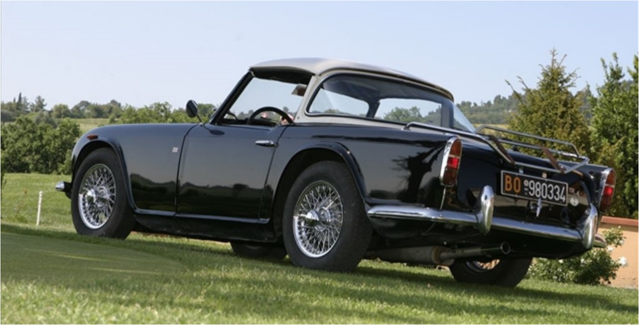
La TR4 con il tettuccio montato. Un accessorio costoso ma di infinita utilità.

La sua buona abitabilità interna, unita ad un discreto bagagliaio, ne permettevano l'acquisto anche come prima vettura e non solo come giocattolo sportivo. Michelotti disegnò anche un rivoluzionario tetto rigido. Era costituito da un lunotto posteriore imbullonato alla carrozzeria e da una sezione centrale rigida rimovibile, disponibile anche in tela e chiamata Surrey Top. Questa innovazione non ebbe purtroppo successo a causa dell'alto prezzo di vendita. Non andò comunque dimenticata e venne ripresa, tale e quale, qualche anno dopo sulla Porsche Targa.