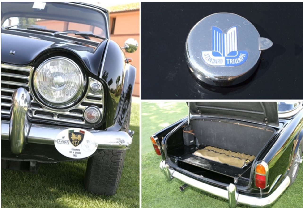
Dettagli della bella linea disegnata da Michelotti: il tappo del serbatoio, il vano bagagli molto spazioso per la categoria.